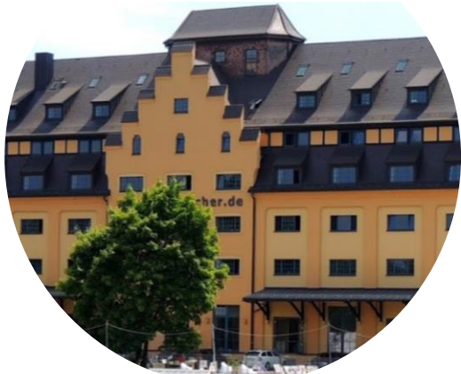
Seminarraum von Carpe verba! im IT- Speicher