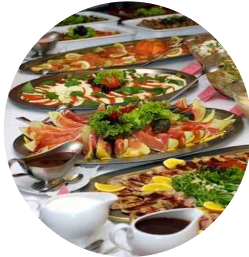
Mittagspause: mehrere Restaurants im Umkreis