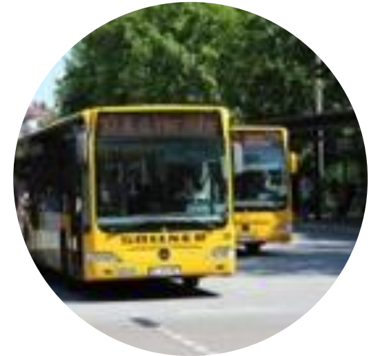
ÖPNV: optimale Anbindung mit den öffentlichen Verkehrsmitteln