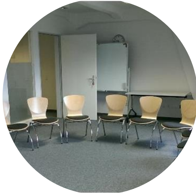
Neuer, hochwertiger und strapazierfähiger Nadelvlies-Teppichboden, Tageslicht durchfluteter Raum