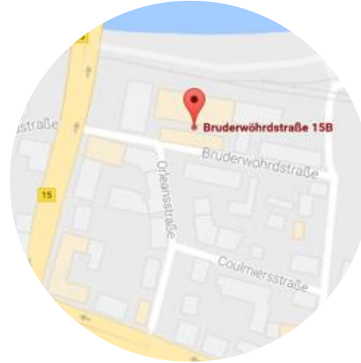
Bruderwöhrdstraße 15b 93055 Regensburg