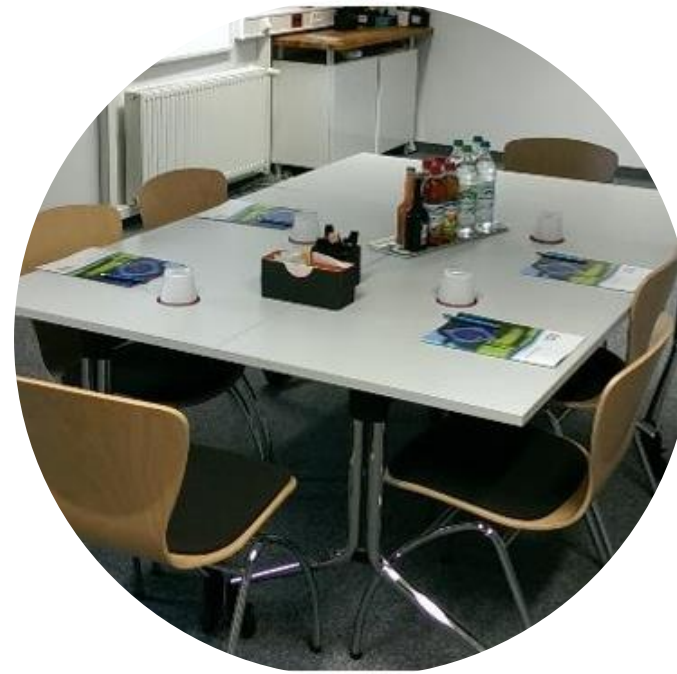
Flexible. Klappbare Tische mit feststellbaren Rollen, bequeme Stühle für längeres Sitzen